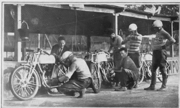
DAVANTI AL BOXE DELLA BIANCHI IN ATTESA DELLA PARTENZA. Fotografia eseguita con « Pakfilms Gevaert ».

Adesso l'Autodromo di Monza ha chiuso i suoi battenti dopo quindici giorni di gare appassionanti. La sorte quest'anno, finalmente, non si è accanita più contro il martoriato campo di gare e ha lasciato che lo